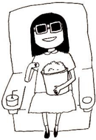
kàn diànyǐng 看电影