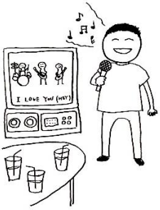
chàng kǎlā 唱 卡拉OK