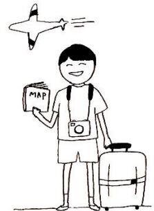
qù lǚyóu 去旅游