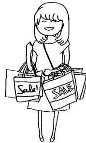
mǎi dōngxī 买东西