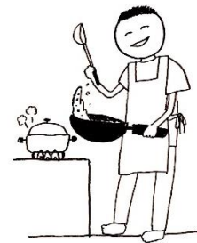
zuò cài 做菜