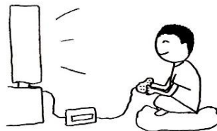
wánr yóuxì 玩儿游戏