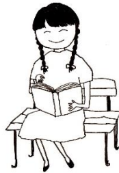
kàn shū 看书