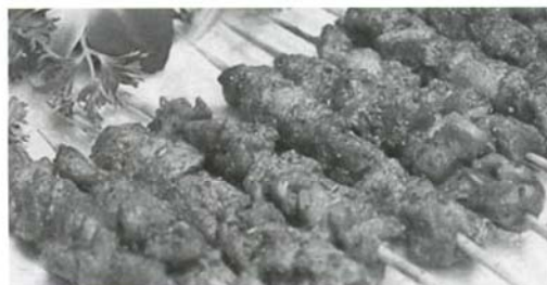
羊肉串 (シシカバブ)