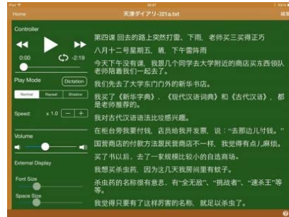
スクリプトの表示